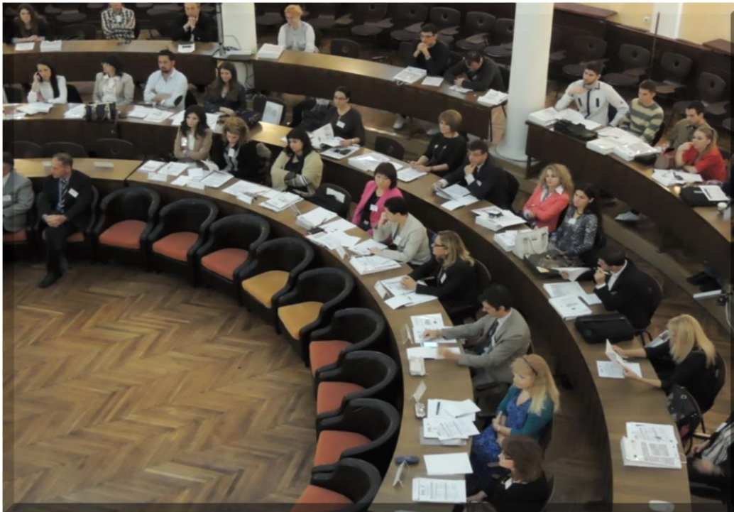
Међународна конференција о каријерном, Ниш, 24. октобар 2013. године

У склопу Темпус пројекта CareerS на Универзитету у Нишу је 24. октобра 2013. године одржана међународна конференција „Србија у оквиру европске парадигме каријерног вођења – препоруке и перспективе”. На конференцији су учествовали гости из Велике Британије, Италије, Пољске, Немачке, представници Министарства просвете, науке и технолошког развоја, Министарства омладине и спорта, универзитетских каријерних центара, послодаваца и цивилног сектора.