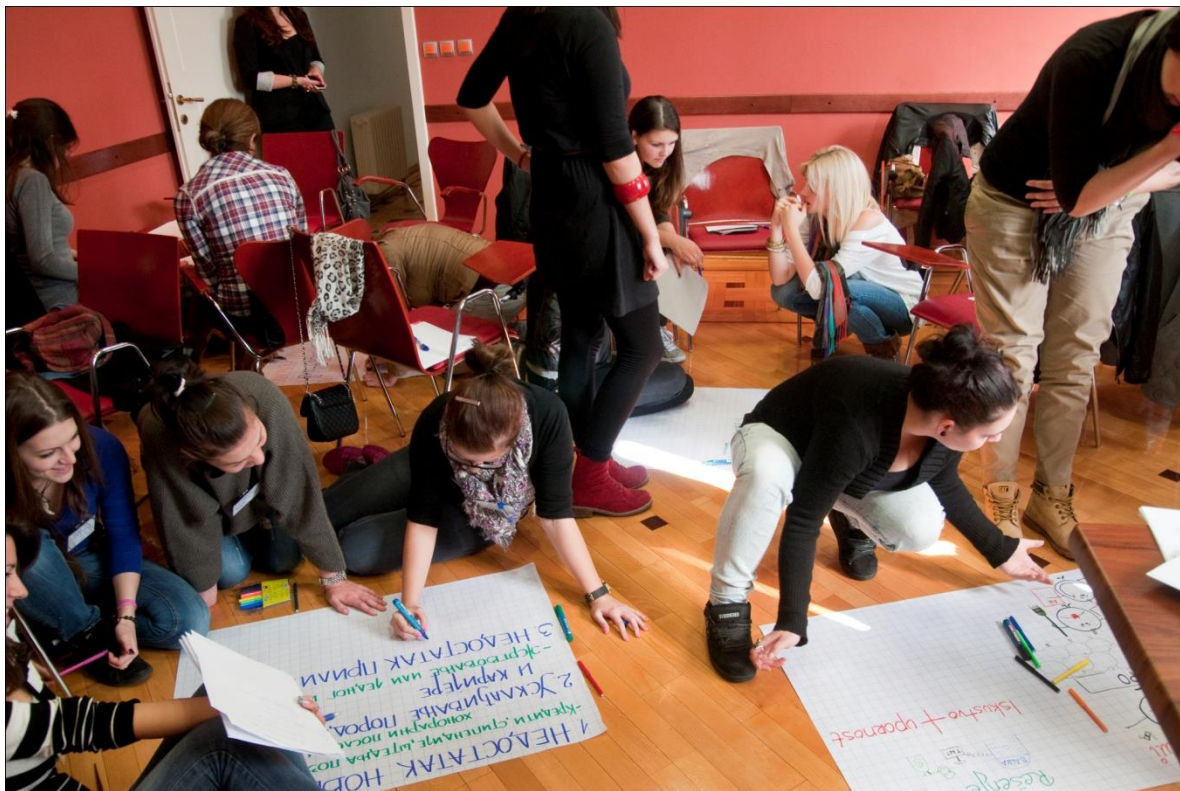
ГИЗ, Професионална оријентација, радионица

У протеклом периоду Еурогајденс центар је реализовао већи број активности како би промовисао европску димензију каријерног вођења и саветовања и пружао свим заинтересованима квалитетне информације из ове области. Еурогајденс центар је окупљао кључне националне актере и партнере управо кроз ораганизовање годишњих конференција које су послужиле и за размену идеја за унапређивање и даљи развој система каријерног вођења и саветовања 5 .