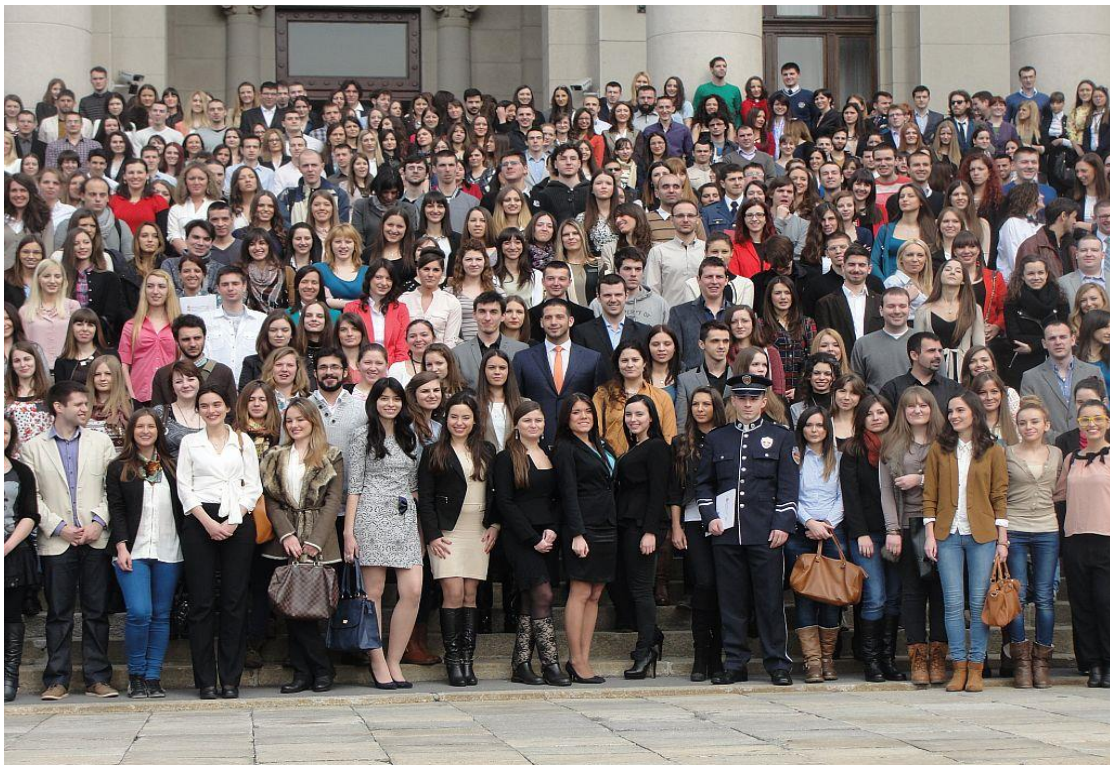
стипендисти Фонда за младе таленте

Фонд за младе таленте је наставио остваривање сарадње са компанијама потписивањем протокола о сарадњи или посредовањем између стипендиста и компанија, институција и организација које су заинтересоване за ангажовање стипендиста Фонда за младе таленте.