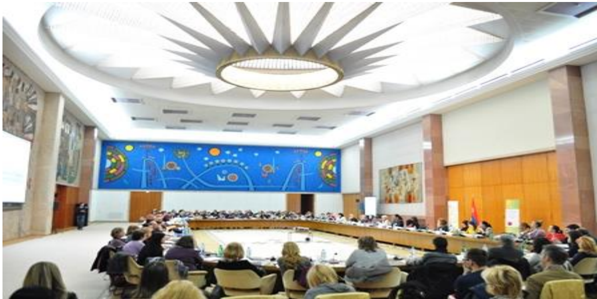
Прва Еурогајденс конференција, 5. децембар 2013. године

присуствовало преко 150 каријерних практичара, наставника и представника организација и институција које се баве каријерним вођењем и саветовањем. Учесници су имали прилику да се упознају са примерима добре праксе из Савезне Републике Немачке, Републике Бугарске, Краљевине Данске и Републике Хрватске, као и да кроз две панел сесије дискутују о каријерном вођењу и саветовању у средњим школама и сарадњи актера на националном и локалним нивоу.