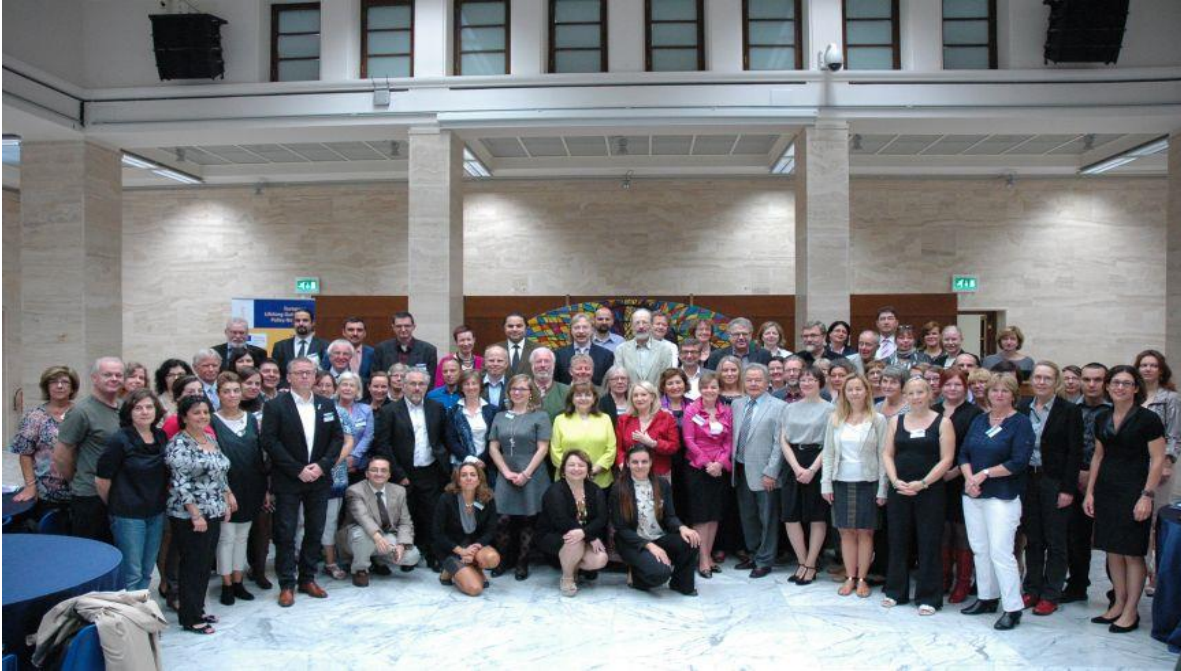
16. пленарна седница Европске мреже политике целоживотног вођења, Рим, октобар 2014. године

Током августа 2014. године Републици Србији је упућен позив да од 2015. године постане пуноправни члан ове мреже, о чему је постигнут договор између надлежних органа власти, тако да је Србија прихватила позив. У међувремену је формирана национална делегација за учешће у раду мреже коју предводи представник Министарства просвете, науке и технолошког развоја, уз учешће представника Еурогајденс центра, Националне службе за запошљавање и Министарства омладине и спорта.