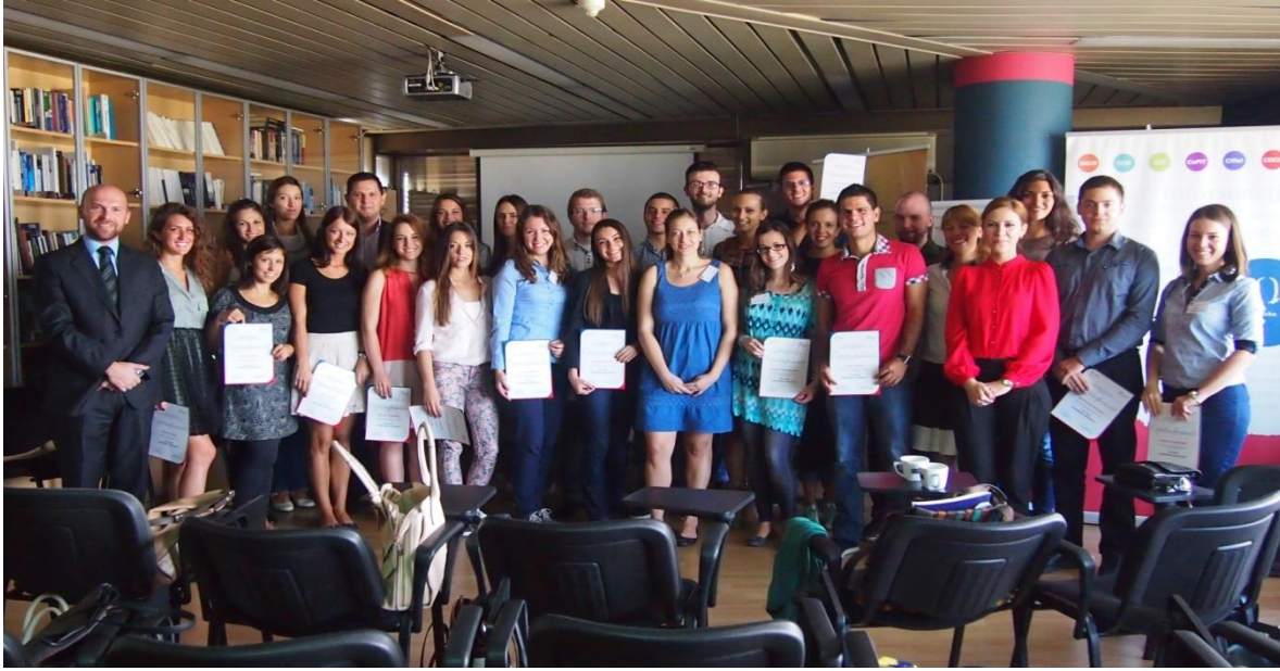
програм Покрени каријеру, Београд, 2014. година

Учесници овог програма су били део „експерименталне групе” којој су биле пружене услуге каријерног вођења и саветовања и два пута испитани путем упитника, пре пружања услуга каријерног вођења и саветовања и након пружања услуга, како би Центар био у могућности да мери степен запошљивости без услуга и са пруженим услугама. У истраживању су учествовали и стипендисти који никада нису користили услуге Центра и били су део „контролне групе” која је служила као основ за упоређивање и боље мерење стварних ефеката каријерног вођења и саветовања на запошљивост. Почетна претпоставка овог истраживања била је та да се експериментална и контролна група разликују по нивоу запошљивости, односно да су млади који користе услуге каријерног вођења и саветовања запошљивији од оних који услуге нису користили. Резултати истраживања представљени кроз извештај јасно говоре о постојању ефеката каријерног вођења и саветовања по запошљивост стипендиста Фонда за младе таленте.