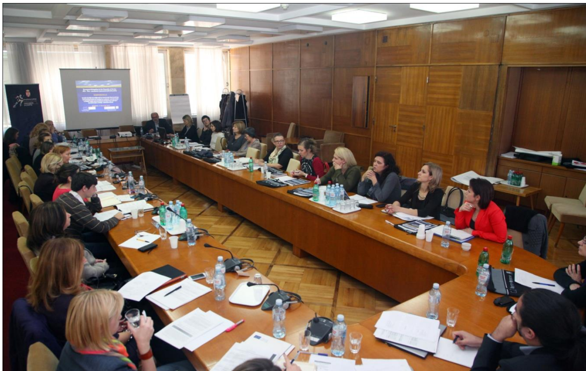
Конференција, 5. новембар 2014. године, Палата Србија, Београд

Резултати истраживања спроведеног у оквиру пројекта „Каријера по мери младих – унапређење методологије за мерење ефеката каријерног вођења и саветовања”, спроведеног од септембра 2014. године до јануара 2015. године, представљени су заинтересованој јавности на конференцији која је одржана у Београду 23. јануара 2015. године.